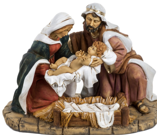
Natività Fontanini - Presepe 40 cm

Misericordia: è l'atto ultimo e supremo con il quale Dio ci viene incontro.